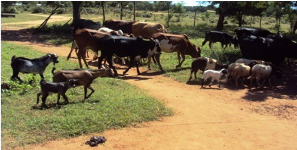
Picha Na: 3 Ng'ombe wa asili Wilayani Masasi

Kutokana na kuongezeka kwa mwamko wa matumizi ya mazao ya mifugo idadi ya baadhi ya mifugo imeongezeka huku mingine ikipungua Mkoani Mtwara kama inavyoonekana katika jedwali lifuatalo:-