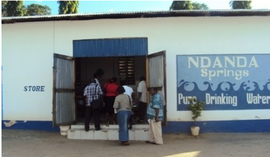
Picha Na.8: Kiwanda Cha Maji Ndanda.