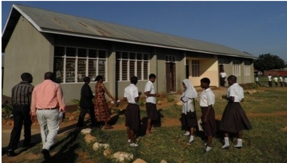
Picha Na.6: Shule ya Sekondari Rahaleo Mtwara/Mikindani

Mabadiliko katika sekta ya elimu yamejitokeza kama ifuatavyo: