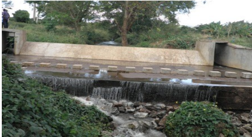
Picha Na: 7. Skimu ya Umwagiliaji Ndanda.